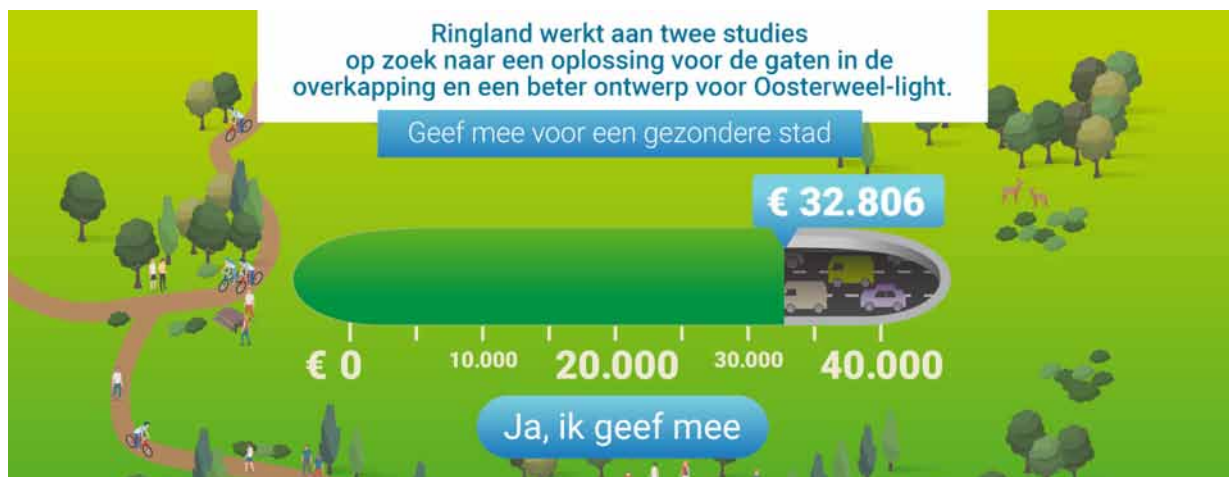
снимка. 1: Табло за призоваване към второ финансиране (Краудфъндинг) в Антверпен - представяне на резултатите след три седмици на мястото на движението на гражданите на „рингленд“.

Свързан с градската мобилност, основаваща се на краудсорсинг, разработването на нови концепции за мобилност е нов начин за привличане на вниманието на гражданите към алтернативни планове или проекти, както и начин за укрепване на развитието на тези алтернативи чрез събиране на допълнителни финансови ресурси, за да се изпълни.