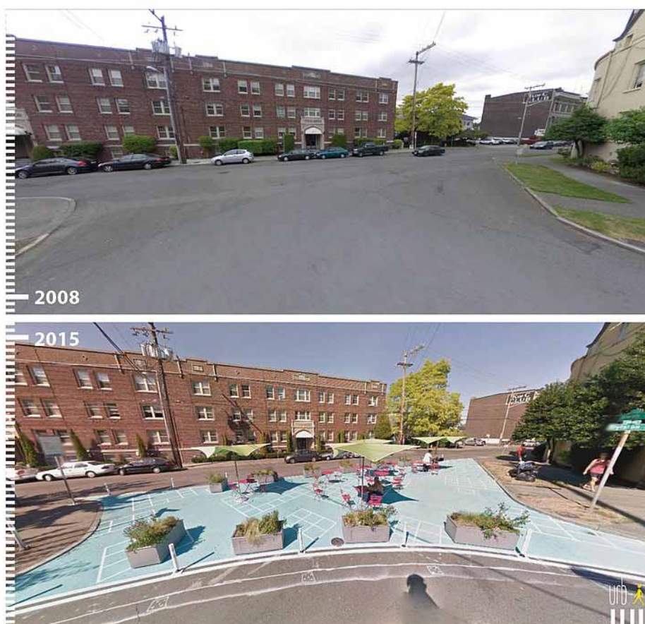
University utca, Seattle

Az LQC projektek definíció szerint rövidtávú kezdeményezések; ez elsősorban azt jelenti, hogy képesek a közterületek fennálló elrendezésének gyors átalakítására. Ahogy már említettük, a téralkotás olyan folyamat, melynek során a végleges megoldás közösségi együttműködés útján és próbafolyamat eredményeként ölt alakot. Nem lehet megjósolni, hogy mennyi időre van szükség a konszenzus kialakításához, ami a végleges kialakításhoz szükséges.