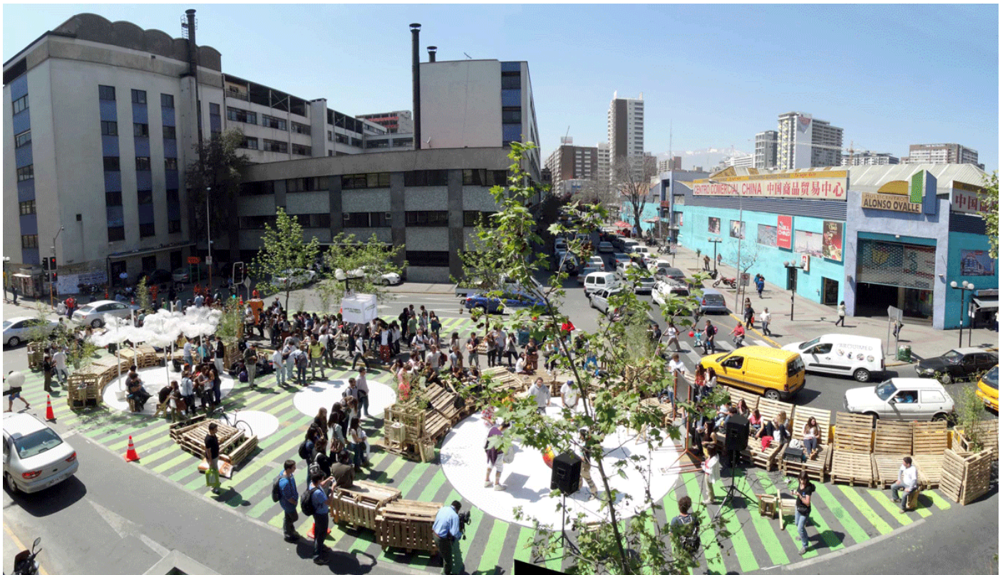
An example of an implemented superblock in Vitoria-Gasteiz; Sancho el Sabio Street.

A megközelítés rugalmassága nem jelenti azt, hogy a projektek tervezésekor gondatlanul járhatunk el, a későbbi módosítások lehetőségében bízva. Mivel a téralkotás fókuszában a közterületek nem-motorizált használatának növelése áll, a projektek során különös figyelmet kell fordítani a nem-motorizált közlekedés létesítményeire vonatkozó előírásokra, különösen a biztonsági előírásokra.