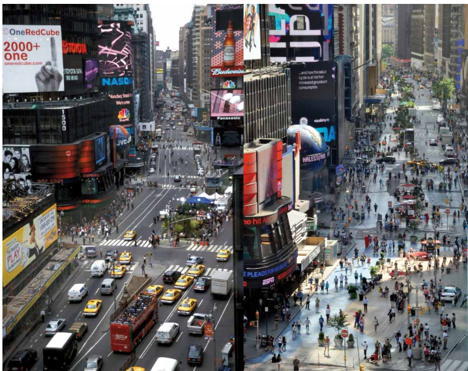
A Broadway a Times Square-nél

A téralkotás újdonsága az ideiglenes és költséghatékony eljárások alkalmazása, hangsúlyozva, hogy a téralkotás inkább egy átalakítási folyamat, mint maga a végleges megoldás. Ugyancsak figyelemreméltó az a képessége, hogy jelentős átalakítások katalizátorává válhat olyan központi helyeken való alkalmazása révén, ahol azelőtt csak nagyléptékű infrastrukturális beruházásokat tudtak elképzelni, ahogyan ezt a New Yorkban lezajlott átalakítás is illusztrálja.