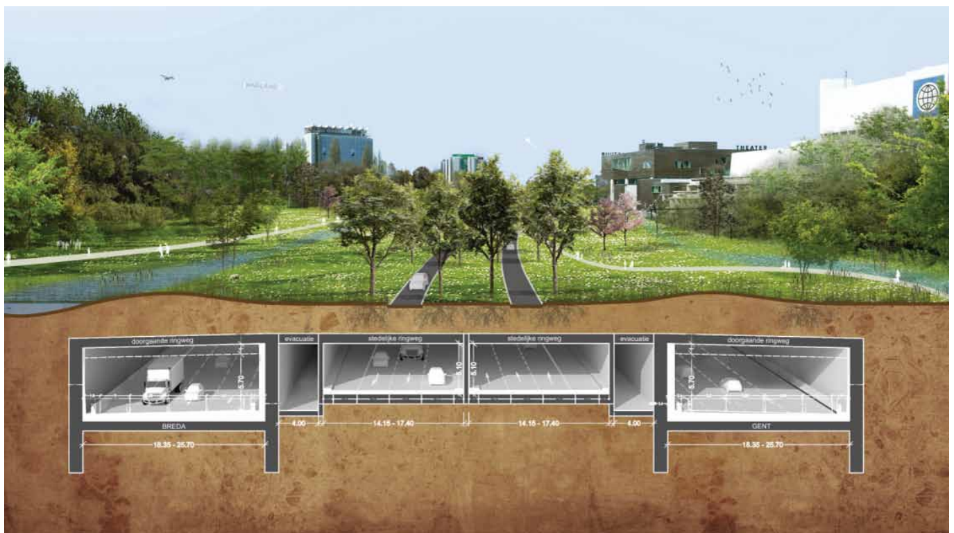
pic. 2 alternative design for the antwerp ring road launched by citizens' movements and taken on board in the government's and city's planning process, based on crowd funded feasibility study.

Credibilitatea mișcărilor cetățenești crește dacă un număr mare de persoane își arată sprijinul donând bani (chiar și sume mici). Rezultatele studiului extind baza de cunoștințe de care dispun mișcările cetățenești, contribuind la apropierea acestora de statutul de parteneri egali ai administrațiilor, în cadrul unor întâlniri și ateliere de planificare co-productivă cu politicienii, desfășurate în contextul unui proces de negociere a proiectelor și alternativelor care să fie susținute. Calitatea procesului de planificare poate spori mai degrabă dacă există un numitor comun al discuțiilor între parteneri, susținut de date concrete, decât printr-o opoziție bazată în mare parte pe slogane.