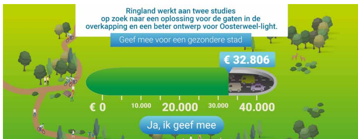
pic. 1: Scoreboard of second crowd funding call in Antwerp –showing results after three weeks on the site of the ‘ringland’ citizens’ movement.

Merriam Webster definește noțiunea de finanțare participativă („crowdfunding”) ca fiind o practică de obținere a finanțării (pentru o nouă afacere, de exemplu) prin solicitarea de contribuții de la un număr mare de persoane, în special cele din comunitatea online. Întrucât este legată de activitățile promovate prin rețelele sociale, aceasta reprezintă o modalitate inovatoare de strângere de fonduri, bazată pe speranța de a beneficia de participarea pe scară largă a publicului. Finanțarea participativă are la bază termenul „crowdsourcing” (externalizare în masă spre publicul larg) din domeniul marketingului. Persoanele care sunt în favoarea dezvoltării unui anumit produs sunt rugate să doneze o sumă mică, fiind astfel vizată obținerea sprijinului din partea unor grupuri mari de persoane. În acest fel, acțiunea de finanțare participativă este și o modalitate de a atrage atenția oamenilor asupra unui anumit produs și asupra producătorului său.