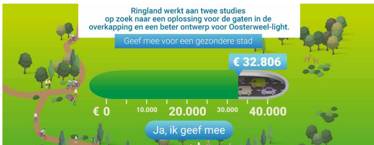
1. ábra: A második antwerpeni közösségi finanszírozási felhívás folyamatjelzője – a 'Ringland' állampolgári kezdeményezés weboldalán látható eredmények három héttel a kampány kezdete után.

A városi mobilitás terén az új mobilitási koncepciók közösségi hozzájárulás útján történő kidolgozása újszerű módszer arra, hogy alternatív tervekre vagy projektekre hívja fel a polgárok figyelmét, egyúttal további pénzügyi források bevonásával segítheti ezek alaposabb kidolgozását.