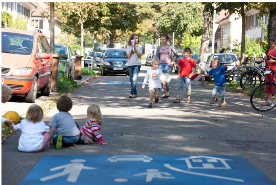
Viena iš daugiau nei 180 „gyvųjų gatvių“ Freiburgo mieste (Vokietija)

„Praeityje šis namų jausmas neapsiribojo vien namu, kuriame buvo gyvenama, tačiau apėmė visą kaimą ar netgi miestą. Vaikams augant, jie ištyrinėdavo apylinkes vis platesniu ratu ir jų „vietos“ supratimas pastoviai plėtėsi. Tačiau moderniam pasaulyje ši erdvė, kurią žmonės vadina savo „namų teritorija,“ smarkiai susitraukė.“ Per paskutinius penkiasdešimt metų miesto planavimas buvo aiškiai orientuotas į motorizuoto transporto eismą, todėl kai kurie rezultatai šiuo metu yra tragiški: baisios ne žmonėms pritaikytos gatvės ir aikštės, sumažėjusi gyvenimo kokybė ir padidėjęs avarijų skaičius, triukšmas ir užterštumas. Europos Sąjunga ne viename politikos dokumente jau pabrėžė šias problemas ir nurodė galimus jų sprendimų būdus. Nors ir negalima sakyti, kad teigiamų padarinių nėra, tačiau beveik visi jie yra miesto centruose. Tuo tarpu, miestų rajonai ir priemiesčiai Europoje vis dar yra smarkiai orientuoti į automobilių eismą ir, būtent todėl, gatvėje žaidžiančių vaikų skaičius yra nedidelis, o socialinis gyvenimas jose – menkas.