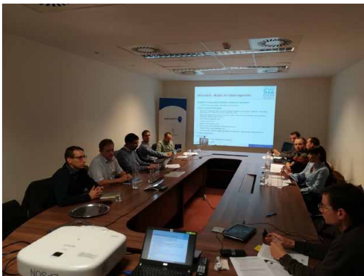
Příklad setkání národní pracovní skupiny v Maďarsku

3. Hlavním cílem a úkolem je připravit a naplánovat implementaci národního programu SUMP nebo aktualizace stávajícího programu.