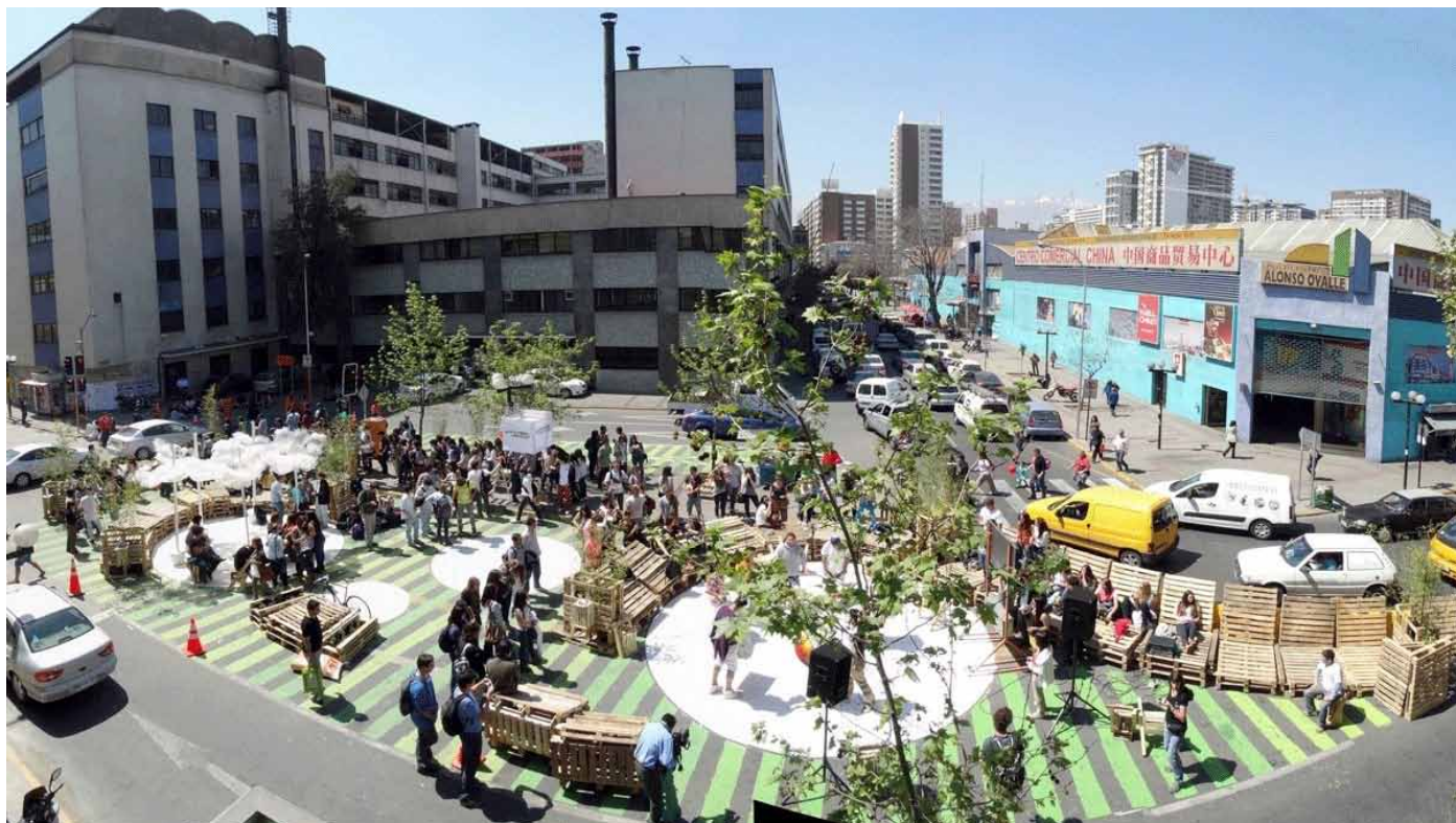
Przykład wdrożonego superbloku w Vitoria-Gasteiz przy ulicy Sancho el Sabio.