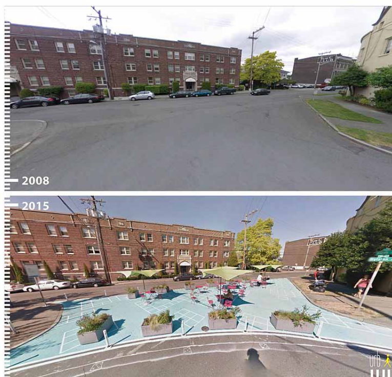
Universiteto gatvė, Sietle, JAV

Taip pat kyla klausimas kas turėtų priimti atsakomybę, pavyzdžiui, įvykus nelaimingam atsitikimui vietų kūrimo teritorijoje. Iš vienos pusės, kadangi tai yra viešoji erdvė, galutinė atsakomybė turėtų tekti savivaldybei. Tačiau remiantis vietų kūrimo požiūriu, pagal kurį bendrai sukurtos erdvės priklauso visiems, kyla neaiškumų dėl teisinės atsakomybės apibrėžties.