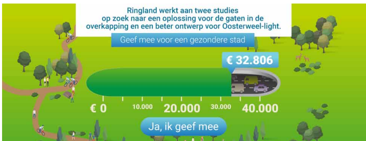
imagem. 1: Painel de avaliação da segunda chamada de crowdfunding em Antuérpia - apresentando resultados após três semanas no site do movimento de cidadãos "ringland".

Sutelktinių išteklių panaudojimas remiasi idėja, jog vartotojams nusprendus, kad tam tikras produktas yra vertas dėmesio, jie taip pat gali nuspręsti kaip šis vis dar kuriamas produktas