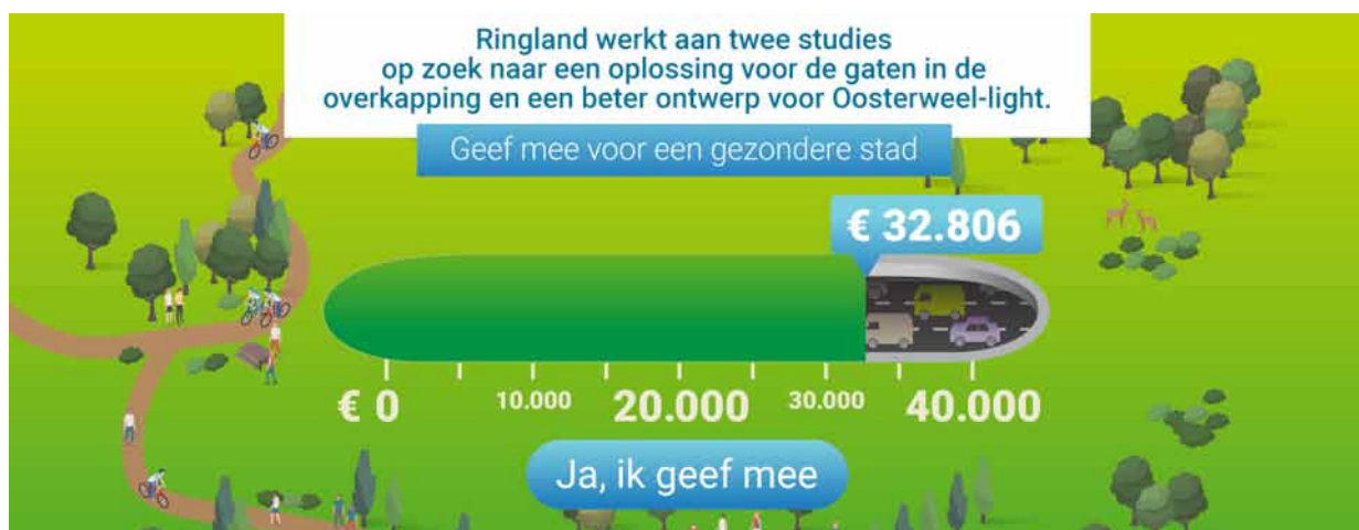
Εικόνα 1: Πίνακας αποτελεσμάτων της δεύτερης πρόσκλησης για χρηματοδότηση μέσω crowdfunding στην Αμβέρσα - Παρουσίαση των αποτελεσμάτων μετά από τρεις εβδομάδες στην ιστοσελίδα του κινήματος πολιτών «Ringland».

Όσον αφορά την αστική κινητικότητα, η ανάπτυξη νέων ιδεών που βασίζονται στο crowdsourcing, αποτελεί ένα καινούριο τρόπο προσέλκυσης της προσοχής των πολιτών σε εναλλακτικά σχέδια